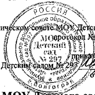
График приема пищи воспитанников МОУ Детского сада № 297 разновозрастной группы круглосуточного пребывания № 4 и № 5

ПРИНЯТО на педагогическом совете МОУ Детского сада № 297, протокол № 1 от 31.08.2023, УТВЕРЖДЕНО приказом заведующего МОУ Детским садом № 297 от 31.08.2023 № 71 С.П.Хаустова